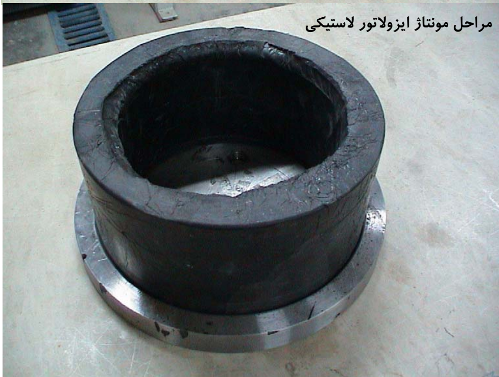
مراحل مونتاژ ایزولاتور لاستیکی