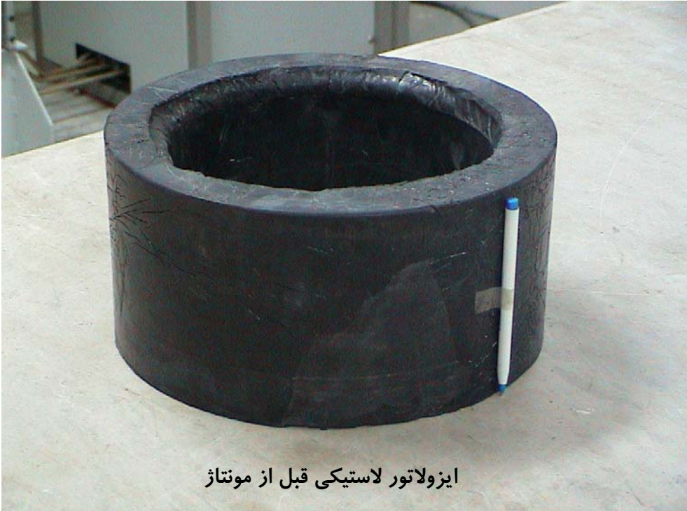
ایزولاتور لاستیکی قبل از مونتاژ